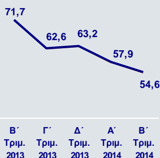
Κόστος προς Έσοδα (%)

Τα συνολικά έσοδα αυξήθηκαν κατά 6,3% και διαμορφώθηκαν σε €490εκ. την ίδια περίοδο, από €461εκ. το Α' τρίμηνο 2014. Τα έσοδα από τις εργασίες στην Ελλάδα αυξήθηκαν σε €354εκ., από €327εκ. το Α' τρίμηνο, συνεισφέροντας κατά 72,3% στα συνολικά έσοδα, ενώ τα έσοδα από τις δραστηριότητες στο εξωτερικό κατέγραψαν μικρή αύξηση κατά 1,3% σε €136εκ. το ίδιο διάστημα.