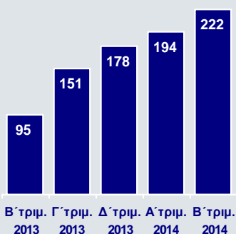
Κέρδη προ Προβλέψεων (€εκ.)

Η βελτίωση των λειτουργικών επιδόσεων της Eurobank συνεχίστηκε για ακόμα ένα τρίμηνο και αποτυπώθηκε στην αύξηση των κερδών προ προβλέψεων σε €222εκ., από €194εκ. το Α' τρίμηνο 2014 και €95εκ. το Β' τρίμηνο 2013. Καθοριστική για τη θετική αυτή εξέλιξη ήταν η ανάκαμψη των εσόδων από τόκους και προμήθειες, η αύξηση των λοιπών εσόδων και η συνεχιζόμενη μείωση του λειτουργικού κόστους. Πιο αναλυτικά: