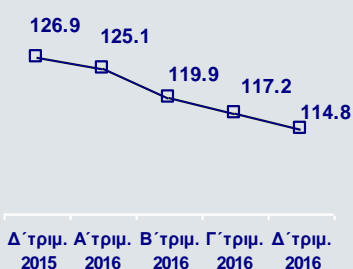
Δάνεια προς Καταθέσεις (%)

Η χρηματοδότηση από τον έκτακτο μηχανισμό ELA μειώθηκε κατά €8,1δισ. το 2016 έναντι του 2015, ενώ η συνολική χρηματοδότηση από το ευρωσύστημα υποχώρησε κατά €11,4δισ. την ίδια περίοδο και διαμορφώθηκε σε €13,9δισ., ως αποτέλεσμα της αύξησης των καταθέσεων και της διενέργειας γeros στη διατραπεζική αγορά. Από τον Σεπτέμβριο 2016 έως και την 21 η Μαρτίου 2017, η χρηματοδότηση από τον ELA μειώθηκε κατά €0,9δισ. σε €12,2δισ.