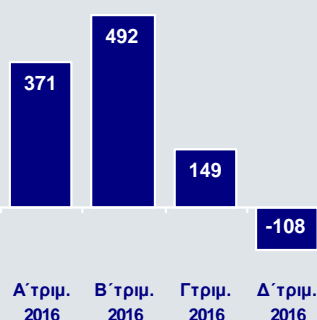
Νέα Μη Εξυπηρετούμενα Ανοίγματα (NPEs, €εκ.)

(NPEs) όσο και τα νέα δάνεια σε καθυστέρηση άνω των 90 ημερών ήταν αρνητικά το Δ' τρίμηνο 2016 και διαμορφώθηκαν σε -€108εκ. και -€85εκ. αντίστοιχα. Ο δείκτης των NPEs μειώθηκε κατά 40 μονάδες βάση σε τριμηνιαία βάση και διαμορφώθηκε σε 45,2% του χαρτοφυλακίου χορηγήσεων στο τέλος του 2016. Παράλληλα τα δάνεια σε καθυστέρηση άνω των 90 ημερών ως ποσοστό του χαρτοφυλακίου χορηγήσεων μειώθηκαν σε 34,7%, από 34,8% το Γ' τρίμηνο 2016 και 35,2% στο τέλος του 2015. Η κάλυψη των NPEs και των δανείων σε καθυστέρηση άνω των 90 ημερών από προβλέψεις βελτιώθηκε κατά 70 και 60 μονάδες βάσης αντίστοιχα το Δ' τρίμηνο 2016 σε 50,7% και 66,1%. Οι προβλέψεις έναντι πιστωτικών κινδύνων διαμορφώθηκαν σε €775εκ. το 2016 και αντιστοιχούσαν σε 1,96% επί των μέσων χορηγήσεων.