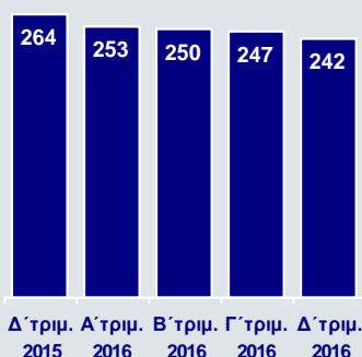
Λειτουργικά Έξοδα (σε συγκρίσιμη βάση, €εκ.)

Οι λειτουργικές δαπάνες μειώθηκαν κατά 4,0% 3 σε €992εκ. το 2016 και κατά 2,1% σε €242εκ. το Δ' τρίμηνο. Στην Ελλάδα οι δαπάνες υποχώρησαν κατά 5,5% 3 σε ετήσια βάση, ως αποτέλεσμα της συστηματικής προσπάθειας εξορθολογισμού του κόστους λειτουργίας. Ο δείκτης κόστους προς έσοδα βελτιώθηκε κατά 1.006 μονάδες βάσης 3 σε ετήσια βάση σε 48,1% και κατά 380 μονάδες βάσης σε τριμηνιαία βάση σε 46,0%.