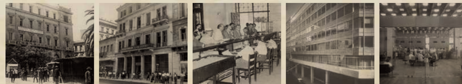
Εικόνες και φωτογραφίες που δείχνουν τους χώρους στέγασης του Ταχυδρομικού Ταμιευτηρίου από την ίδρυσή του μέχρι σήμερα

Μια συνοπτική παρουσίαση της προσφοράς και δράσης του Ταχυδρομικού Ταμιευτηρίου, με τις ενότητες: 1. Ιστορικά του Ταχυδρομικού Ταμιευτηρίου, 2. Διαχρονική προσφορά στην ελληνική οικονομία και κοινωνία, 3. Προβολή και διάδοση της ιδέας της αποταμίευσης, γίνεται παράλληλα στην αίθουσα συναλλαγών του Κεντρικού Καταστήματος του Δικτύου Νέο Ταχυδρομικό Ταμιευτήριο .